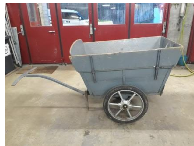
Brouette → Fr. 150.-