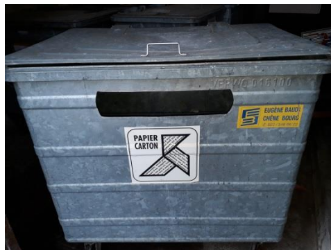
Container métallique à papier sur roulettes, 800 litres → Fr. 100.-