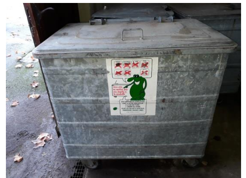
Container métallique sur roulettes, 800 litres → Fr. 100.-