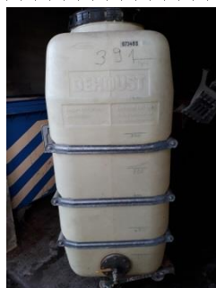
Cuve plastique 1'500 litres → Fr. 150.-