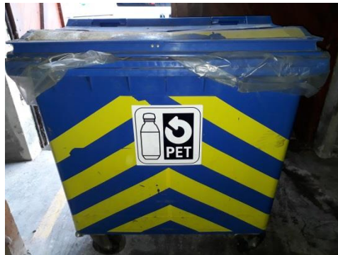
Container à PET sur roulettes avec poignées latérales, 800 litres → Fr. 50.-