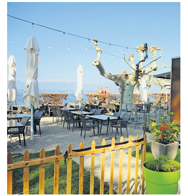
Vue sur le lac. DENISE BERNASCONI