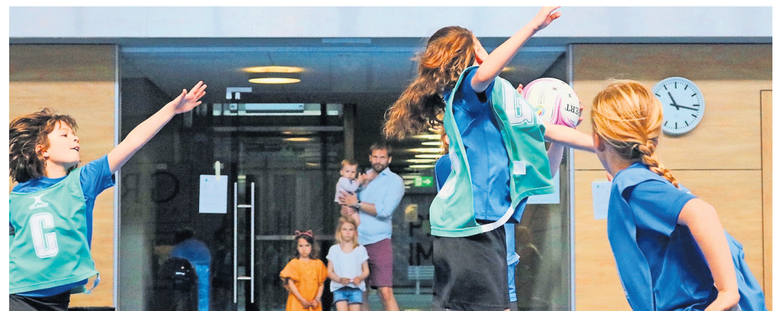
Des joueuses du Meinier Netball Club en plein match.

Un joli succès pour ce jeune club 100% féminin, qui n'a cependant pas l'intention de s'arrêter là dans ses objectifs de promotion et de développement de la pratique de ce sport. Et pour ce faire, quoi de