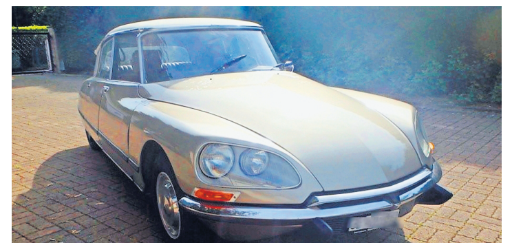
La Citroën DS 23 Pallas de 1974 l'accompagnera dans son périple.