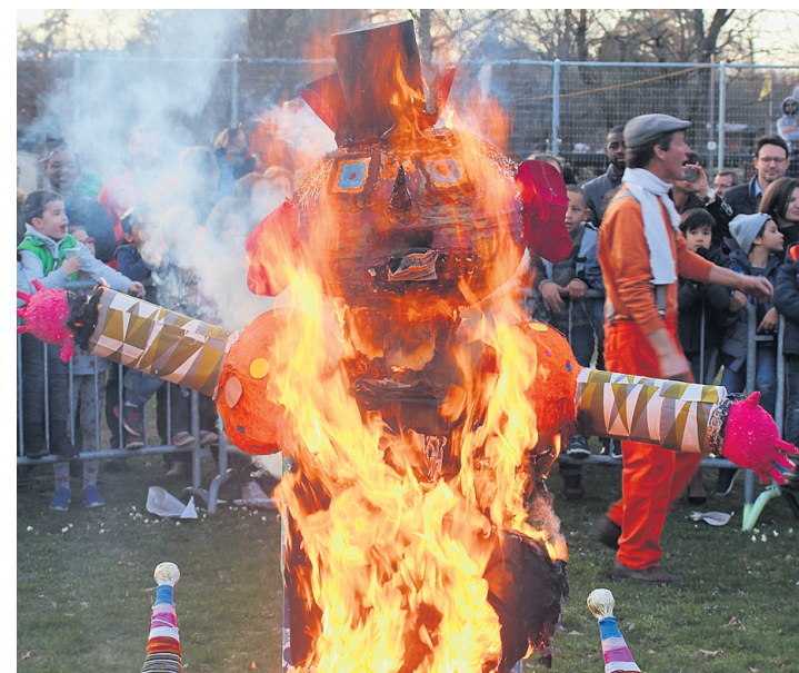
L'embrasement du Bonhomme Hiver. JEAN-PIERRE ABEL

La période de beau temps qui a suivi cette sympathique manifestation semble confirmer que l'hiver est vraiment terminé et l'on se réjouit de retrouver le Bonhomme Hiver l'an prochain pour un nouvel embrasement.