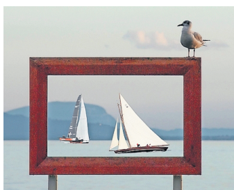
Depuis les quais, à Montreux.