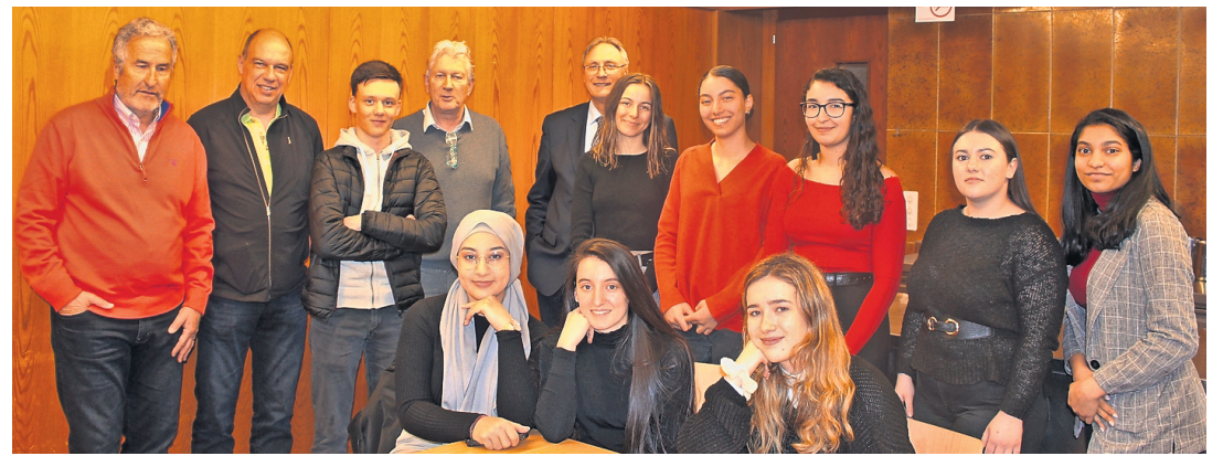
Les autorités communales et une partie des Bellevistes qui ont 18 ans cette année. JEAN-PIERRE ABEL

Après cette partie officielle, suivie de questions et réponses sur la vie communale, tout le monde s'est rendu au bowling de La Praille pour y disputer quel-