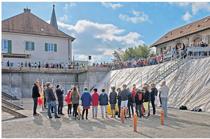
Les autorités communales, en compagnie des élèves de 8P et des enseignants. KATHELIJNE REISE SAILLET

C'est à l'occasion de la semaine de la démocratie que les écoliers