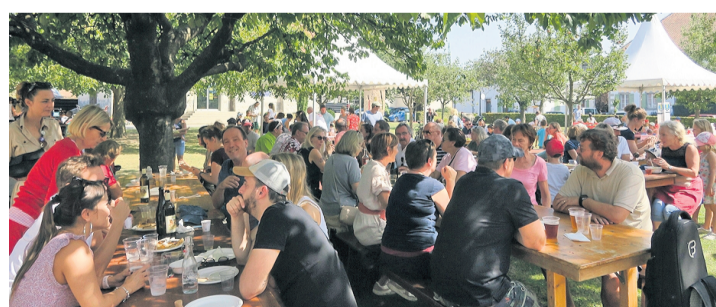
Déjeuner sous les arbres pour les visiteurs de la Fête de la pomme et du terroir à Meinier. CÉCILIA HAUSER

Et pour prolonger les dégustations et les découvertes, artisans et sociétés locales étaient présents