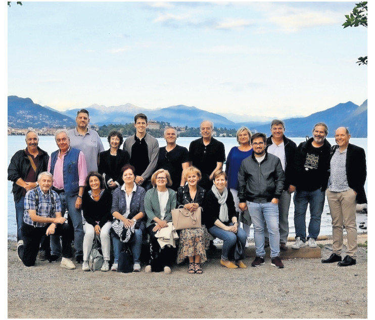
Le Conseil municipal de Corsier en voyage sur les îles Borromées.

Privilégier une destination à valeur pédagogique, ou partiellement ou entièrement en Suisse, est une volonté affichée de cette législature, nous ne pouvons que les en féliciter! Un nouveau Conseil municipal sera élu dans quelques mois, il ne nous reste plus qu'à remercier les actuels élus pour leur implication active dans la gestion de la commune de Corsier. Caroline Vinzio-James