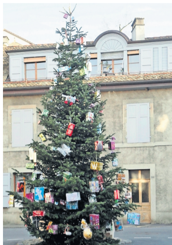
Le sapin de Noël décoré par les enfants. DENISE BERNASCONI

De superbes paquets de toutes les couleurs et de toutes les formes: des bleus, des rouges, des verts, des petits, des gros, certains en forme de gros bonbons, quelques-uns délicats ou d'autres paraplés d'une petite phrase sympathique.