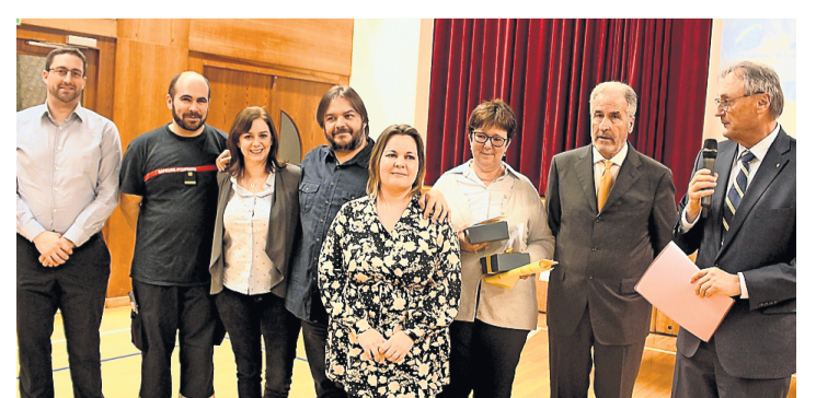
Le Conseil administratif félicite l'équipe des jeunes, presque complète, qui a créé et animé l'Escape Game pendant deux ans.