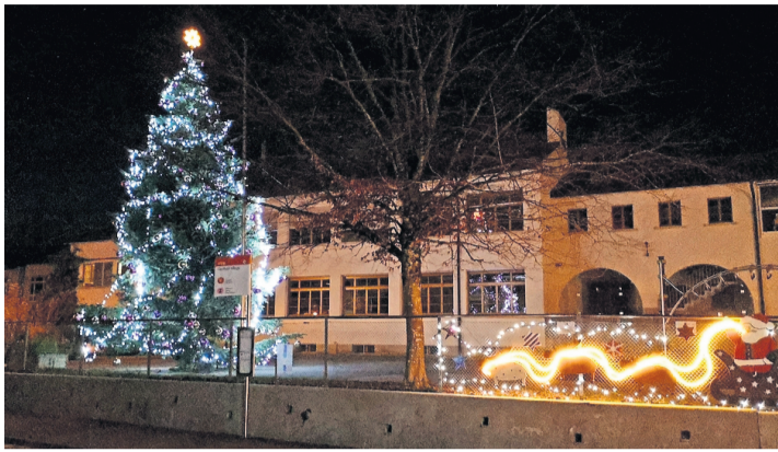
Le sapin qui se trouve devant l'école primaire. TARA KERPELMAN PUIG

«Pour beaucoup de personnes, peut-on lire sur le site de l'association, il est important de pouvoir partager ces moments forts sympathiques et éviter une solitude