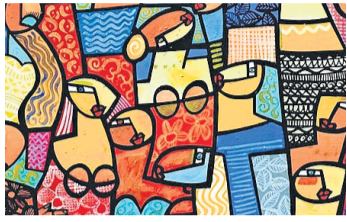
Détail d'une œuvre de l'artiste Xavier Hortola.

■ Du 11 au 22 décembre, de 11 h à 13 h et de 15 h à 19 h, à la galerie d'Anières, exposition de peintures figuratives modernes et de sculptures en bois de Xavier Hortola. Fermé le lundi.