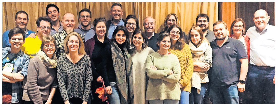
Les bénévoles et membres du comité de l'Association des caisses à savon. FRANÇOIS JACCARD