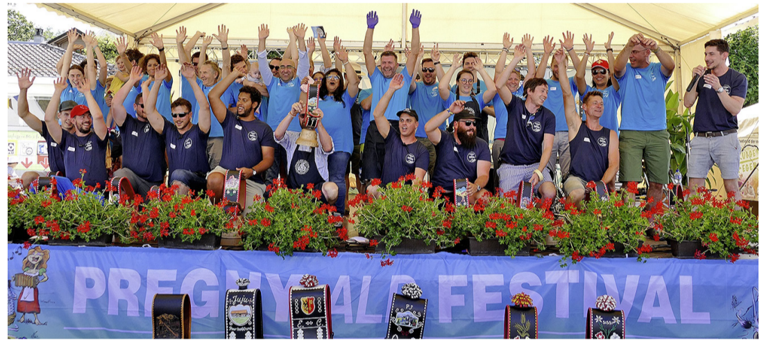
L'équipe des bénévoles du Pregny Alp Festival. PAF

Les membres du comité, des jeunes habitants pour la plupart mais pas seulement, ont su s'entourer d'institutions publiques et privées qui soutiennent financi-