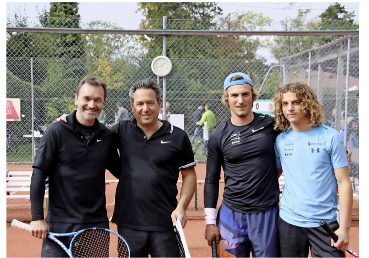
Les finalistes hommes du tournoi en double. STÉPHANIE TOURETTE