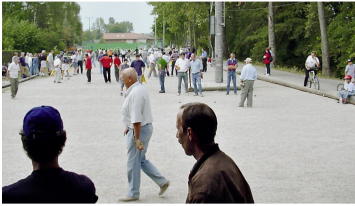
Les joueurs de pétanque sont en piste.