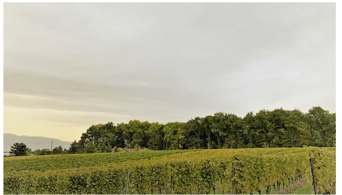
Large vue sur le Domaine de Groubeaux et ses vignes.