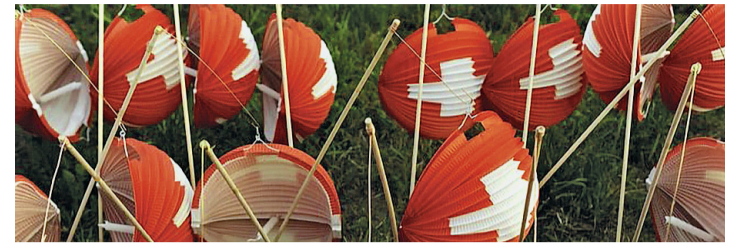
Sans les lampions, la fête ne serait pas aussi belle.

Cela étant, c'est dans un cadre champêtre que le public sera accueilli pour assister aux divers spectacles folkloriques. Les participants pourront se restaurer et étancher leur soif sur les stands te-