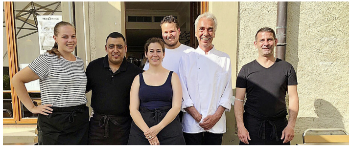
La nouvelle équipe est là pour vous servir! DR

Jovial, dynamique, des projets plein la tête, le chef se veut positif, bien décidé à amorcer cette saison sous les meilleurs auspices. Et c'est dans un établissement ra-