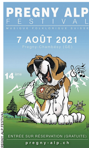
Affiche de l'édition 2021.