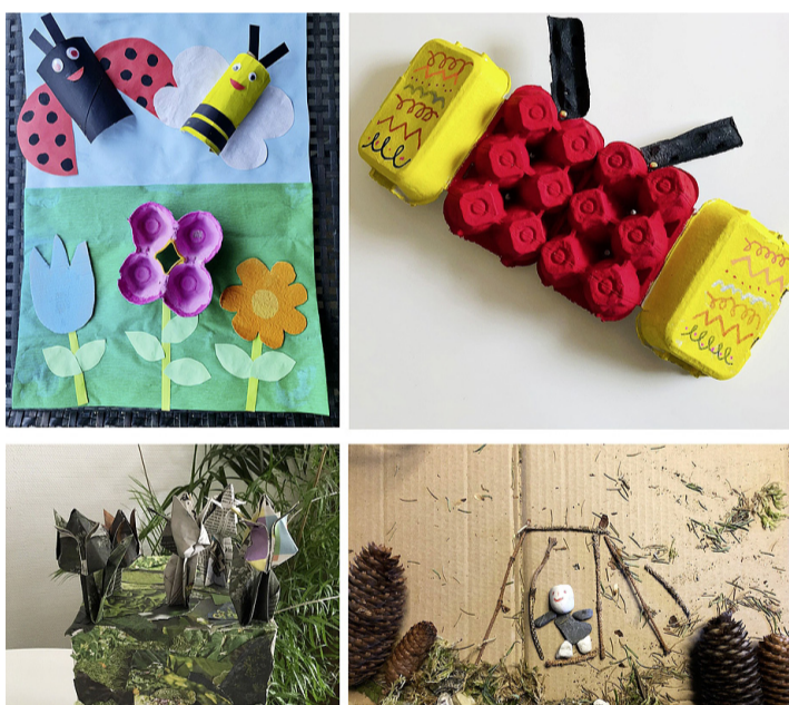
Montage de quatre créations présentées au concours.

Les huit lauréats ont reçu une entrée gratuite pour un centre d'escalade à Versoix et tous les participants ont eu un prix de participation sous forme de bon d'achat à faire valoir dans l'épicerie de quartier.