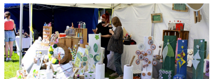
Vue sur un stand du marché de printemps. CAROLINE DELALOYE

Forts de ce succès, les organisateurs se disent prêts à proposer d'autres événements comme celui-ci, notamment le marché de Noël, prévu les 4 et 5 décembre prochains. Caroline Delaloye