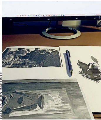
Dans le cadre du programme Eco-Schools.

L'association J'aime ma planète, basée à Genève, a entrepris un programme éducatif dénommé «Eco-Schools», avec un label du même nom, dernière étape valorisant les efforts entrepris par les écoles participantes. Ce programme axé sur la problématique du développement durable est destiné aux écoles de Suisse. Sur la Rive gauche, le collège Saint-Louis, à Corsier, y prend part et a obtenu ce label Eco-Schools.