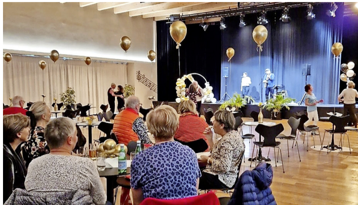
Après-midi de danse au Centre communal. MAIRIE DE GENTHOD

Une cinquantaine de personnes y ont participé, certains membres du Bel Âge, d'autres pas, et quelques-uns de l'EMS Fondation Mimosas à Genthod. Un duo de musiciens a animé l'après-midi avec l'accordéon et la guitare électrique, proposant des danses de salon ainsi que de la musique des années 80. Les participants ont pu