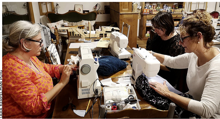
Il n'y a pas que des machines à café à l'épicerie!

Toutes de niveaux différents, elles ont pu amener leurs propres projets et matériel pour se faire guider par les organisa-