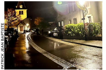
extinction de l'éclairage public totale entre 1h et 5h du matin. Patrick Jean Baptiste

cadre du plan de sobriété énergétique du canton, pour faire face aux risques éventuels de pénurie, la Commune va réduire l'éclairage public sur son territoire. Depuis le 18 novembre, l'éclairage public des quartiers de Corsier-Port et Maisonneuve est diminué sur les routes suivantes: chemin du Port, quai de Corsier, route de Corsier et chemin de Bellebouche. À partir du 1 er décembre, le centre du village et ses routes périphériques ont une