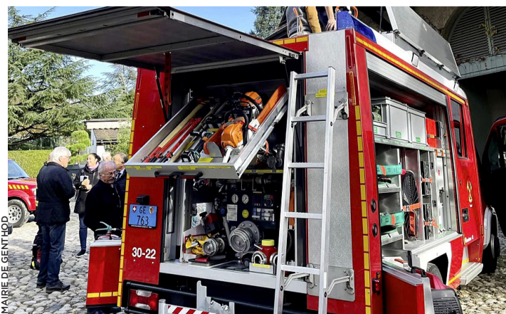
MAIRIE DE GENTHOD