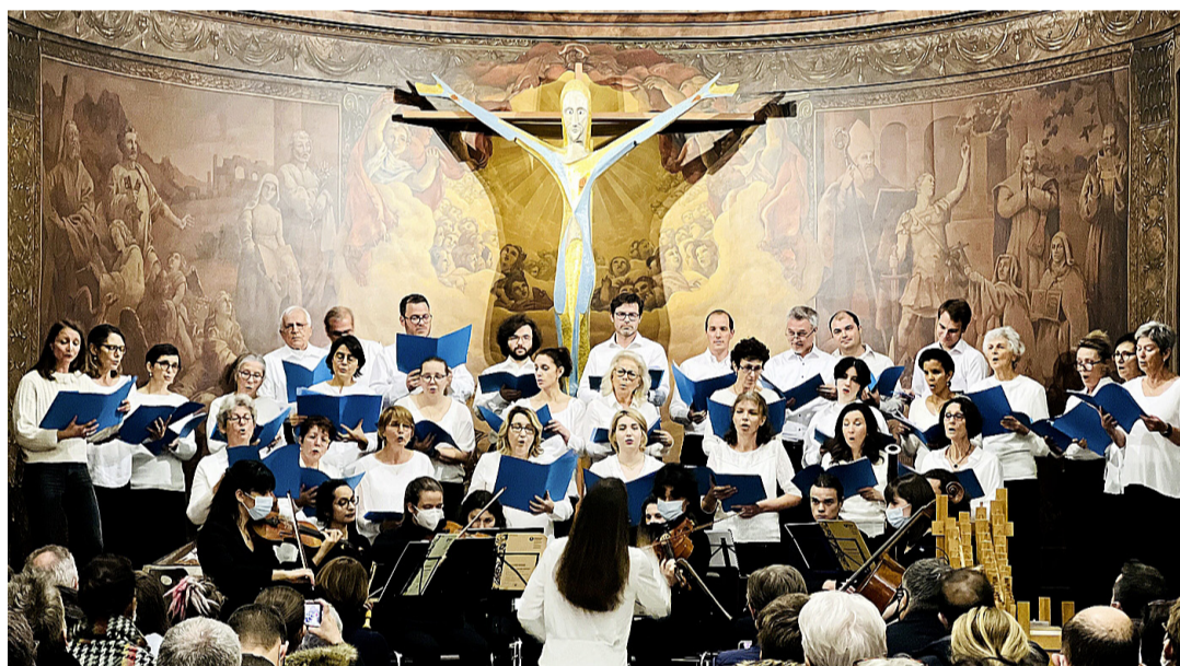
Le chœur Coherence lors de son concert de Noël de 2021. PATRICK JEAN BAPTISTE

La «Misa Criolla» est comme son nom l'indique une messe créole, l'une des plus importantes œuvres de la musique contempo-