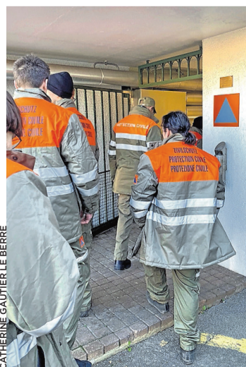
L'entrée de l'abri PC.