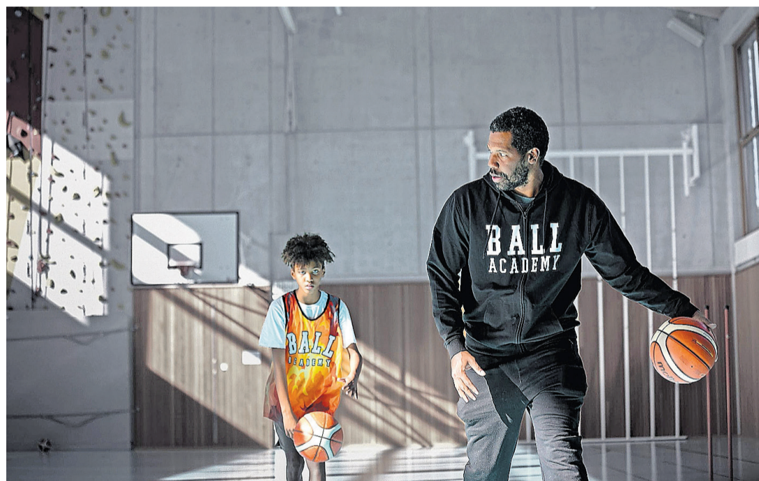
Les entraînements se passent à la salle de gymnastique de Genthod. BALL ACADEMY

Inscriptions au camp ou pour les cours, et pour plus de renseignements, veuillez écrire un mail à info@ballacademy.eu .