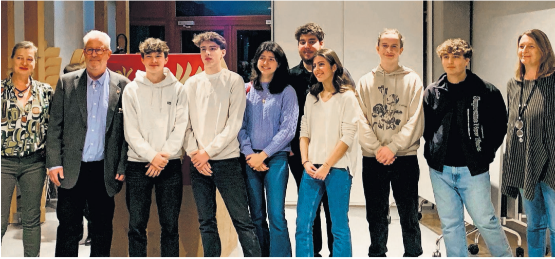
Après deux années d'annulation, les autorités choulésiennes ont enfin pu inviter les habitants à son traditionnel apéritif de début d'année. Ce fut, entre autres, l'occasion d'accueillir les quatorze jeunes qui atteindront leur majorité au cours de l'année. Sept d'entre eux ont participé à l'événement. CHRISTINE JEANNERET