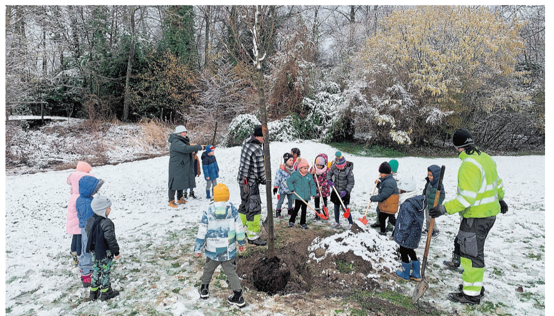
Plantation d'un arbre par la classe des 1P de l'école d'Hermance. MATHIEU DARDEL

Par le passé, dans les villages, l'orme servait de point de rallie-