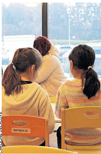
Moment de jeu à la crèche intercommunale.