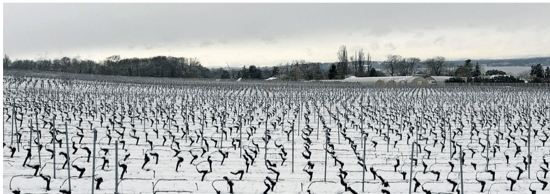
Les vignes sous la neige. ANTOINE ZWYGART

Nous avons la chance d'habiter dans une commune rurale comportant de nombreux biotopes différents. Notre région possède des paysages magnifiques. Notre village, avec sa rue Centrale comportant plusieurs anciennes