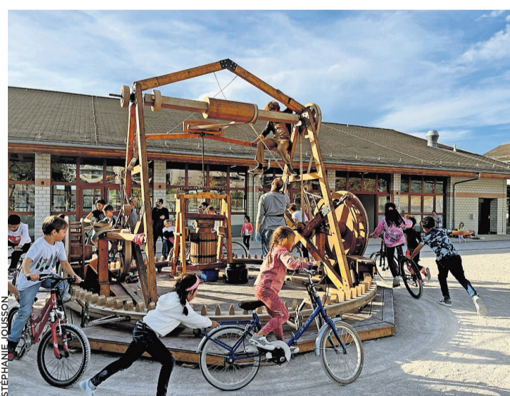
L'ingénieux pressoir label-Vie en plein exercice.

Sans discrimination aucune, les fruits apportés, une fois rincés et coupés en deux, sont passés par le broyeur qu'active de ses muscles un joyeux mélange d'enfants et d'adultes. Leur transformation se poursuit dans le tonneau central, muni d'un grand filtre de tissu. Là, une presse descend, grâce à des rouages activés par des cyclistes, laissant apparaître en bout de course le nectar délicieux. Celui-ci passera encore par une dame-jeanne et un dernier filtrage avant de terminer dans les bouteilles mises à disposition par l'association label-Vie et offertes par la Mairie.