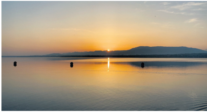
La plage de Chambésy au lever du soleil.

Vous pourrez imaginer faire de belles promenades sur les sentiers communaux, en découvrant ou redécouvrant par exemple l'étang des écrevisses et les champs atten-