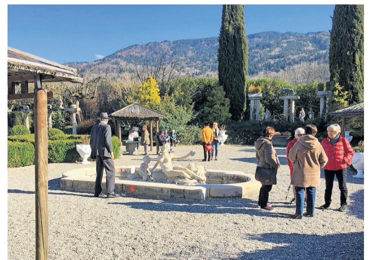
Le groupe de loisirs au château d'Avully.