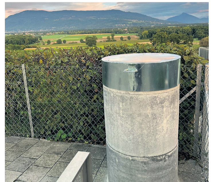
Le pilier se situe au coin du parking du cimetière de Choulex. OLIVIER LOMBARD

Et la dernière utilité de ce «monument» communal concerne l'altimétrie. Son altitude a été très précisément calculée. Sous son couvercle de métal se trouve une embase pour pouvoir fixer une antenne ou des instruments de géomètres. À Choulex, on sait désormais où l'on se trouve!