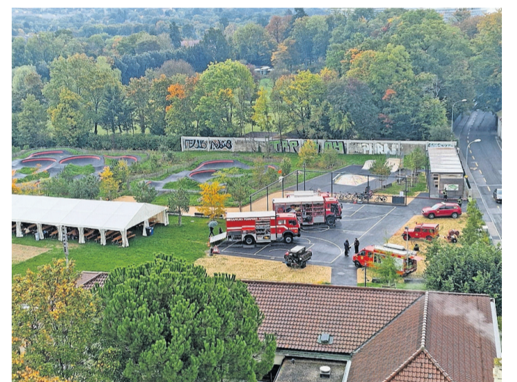
Les villageois ont pu admirer le matériel de la CP41. CP41

Finalement, force est de constater que l'anniversaire de cette compagnie a été bien plus qu'une simple célébration. Ce fut un moment de souvenirs, une reconnaissance du présent mais aussi une anticipation sur l'avenir de la commune. En tant que piliers de Pregny-Chambésy, ces héros en uniforme méritent toute notre considération et notre respect.