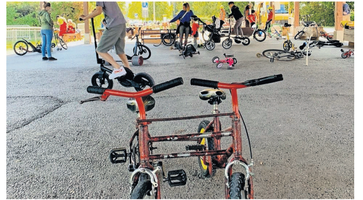
Les vélos improbables de 1001Roues. CHRISTINE JEANNERET

los improbables, customisés de manière à défier toute tentative de contrôle, le bicyclogue mentionné ci-dessus, ainsi que PRO VÉLO Genève, association de défense des cyclistes, qui a proposé quelques-unes de ses activités ludiques phares, comme le vélo-shaker, le vélo-polo statique et le parcours d'agilité. Cette journée ensoleillée s'est clôturée par un apéritif offert par la commune et la projection de l'excellent film d'animation, «Les triplètes de Belleville». Cette journée de l'environnement a démontré que choisir le vélo pour se déplacer contribue bien plus qu'au seul bienfait écologique: il est un vecteur social,