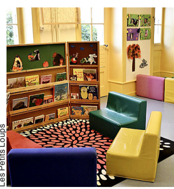
Les Petits Loups

«L'environnement est magnifique, les enfants peuvent jouer